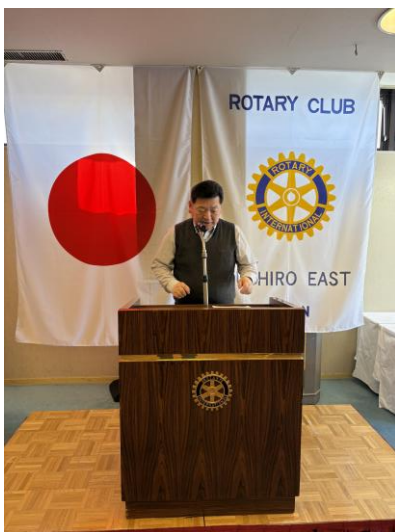
清水会長エレクト