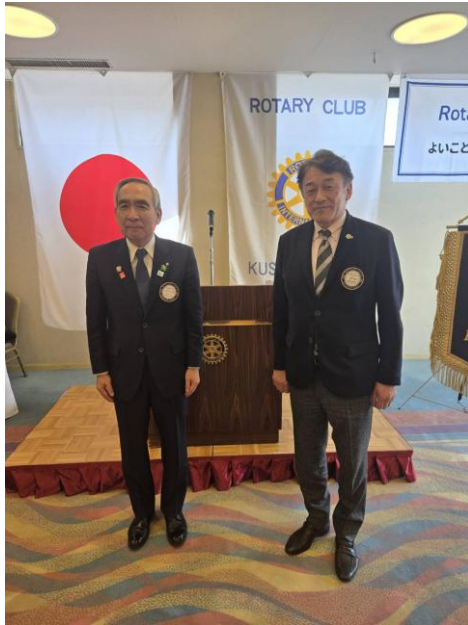
玉垣会員に認証ピンの贈呈