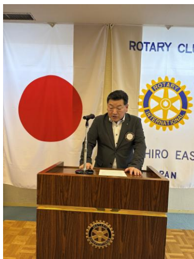
清水会長エレクト報告